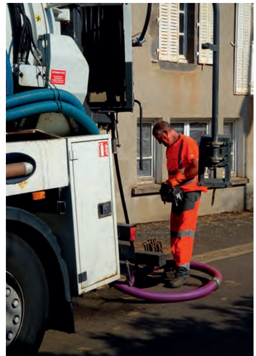
Photo du passage annuel de l'hydrocureur dans le réseau d'assainissement collectif du bourg.