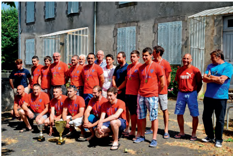
Les joueurs de l'USC à l'honneur