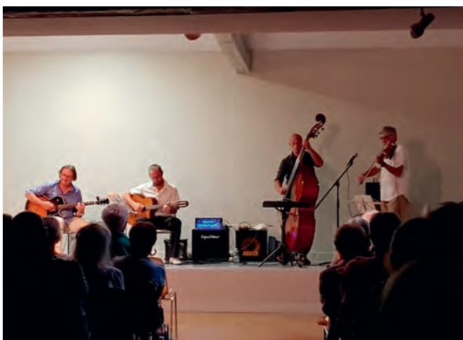
Concert de Jazz du 14 juillet 2018