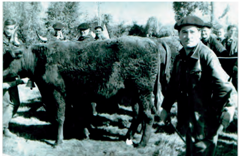
photo d'archives comice 1970

La fête du pain avec génisse à la broche est devenue au fil des années un rendez-vous estival. Elle rassemble non seulement population rurale, mais aussi de nombreux touristes. Le comice agricole, organisateur de la manifestation, conforte la renommée acquise de cette fête. Vente de pains, génisse à la broche, aligot, bal, pétanque, jeux pour enfants faisaient partie du programme. Rendez-vous le 13 octobre au comice communal « Salers ».