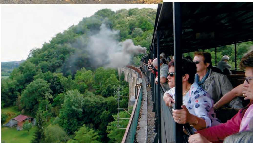
Voyage du Club Inter-Ages à Martel