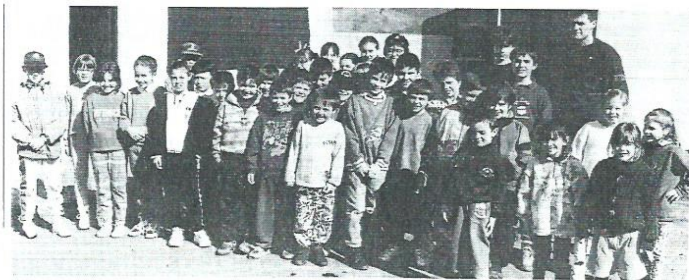
TICKET-SPORTS des jeunes de Chaussenac, d'Ally, Barriac, ....

L'Assemblée Générale de la Caisse de Pleaux s'est déroulée le 29 mars. Quelques chiffres à retenir : le capital de la Caisse Locale s'élève à 1,714 millions de francs. La collecte a augmenté en 1995 de 8 % par rapport à 1994. Elle s'élève à 295 millions de francs dont 64 millions sous forme de SICAV. Bien qu'ils soient en augmentation par rapport à 1993 et 1994, le montant des prêts est de 31,6 millions de francs dont 9,8 millions pour le secteur agricole et 10,7 pour les professionnels (artisans, commerçants,....). On constate donc que l'épargne réalisée localement permettrait largement de financer des volumes plus importants de prêts (à condition d'avoir des projets industriels, touristiques, et des équipements d'infrastructure).