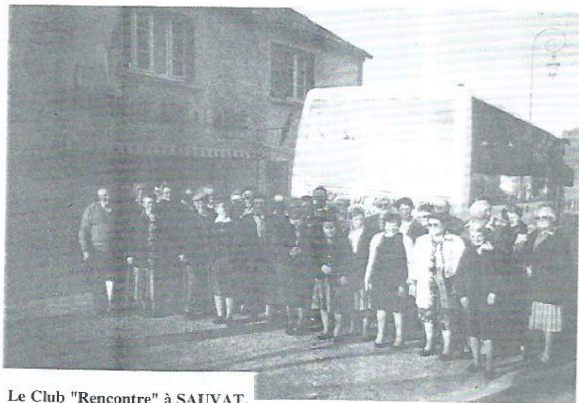
Le Club "Rencontre" à SAUVAT.

En juin, la sortie d'une journée est prévue en montagne dans la région de CONDAT, puis en août, la kermesse annuelle.