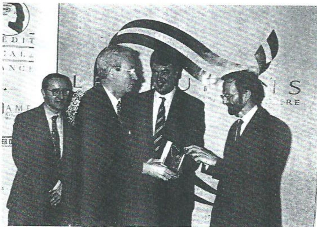
Remise du Prix de la COMMUNICATION FINANCIERE à PARIS.