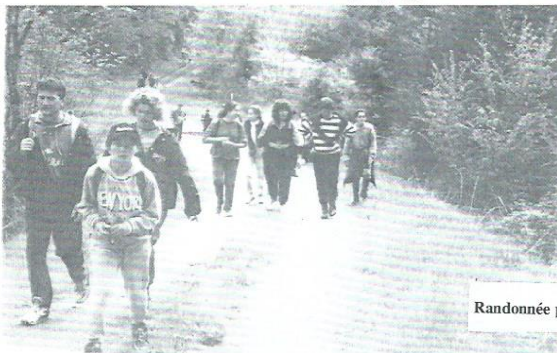
Randonnée pédestre du mois de Mai.