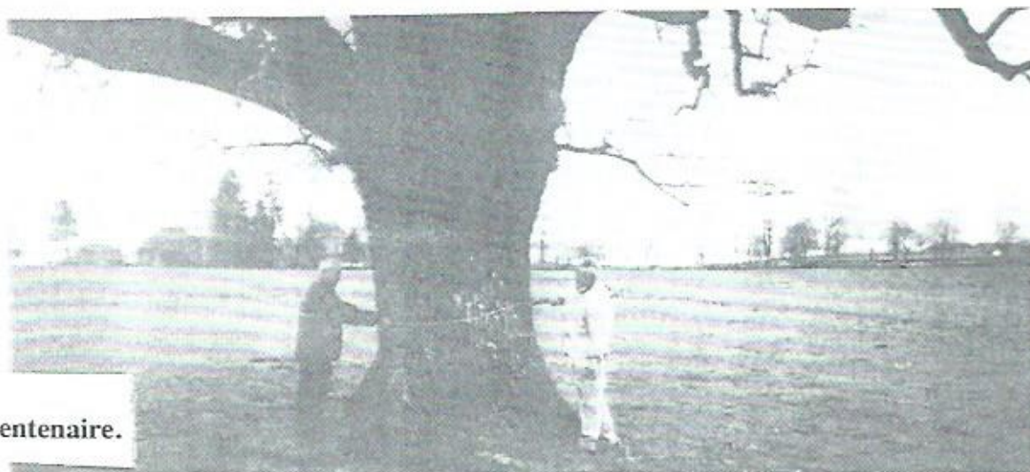
Un chêne bi-centenaire.