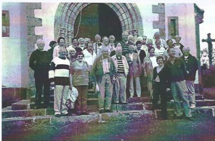
Visite de nos amis hollandais (V.V.A.) en juin dernier.