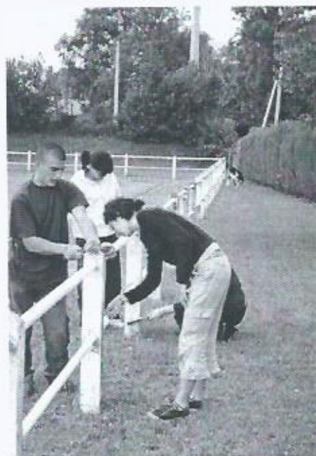
Photo souvenir du chantier 2004

* Jeunesse et Reconstruction installeront des bancs, une aire de pique-nique et un sentier botanique au Moulin d'Ostenac.