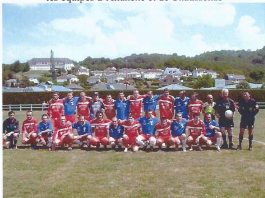
Finale Coupe Barrès, 18 juin 2006 les équipes d'Allanche et de Chaussenac