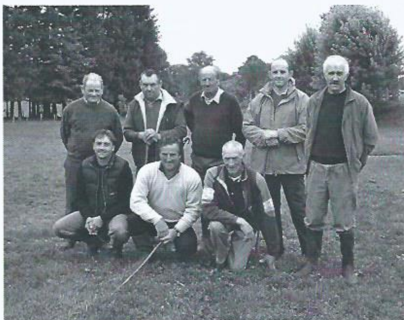
Comice d'octobre 2005 (jury, président et vice-président)

Nous remercions tout particulièrement les membres du jury ainsi que tous les exposants.