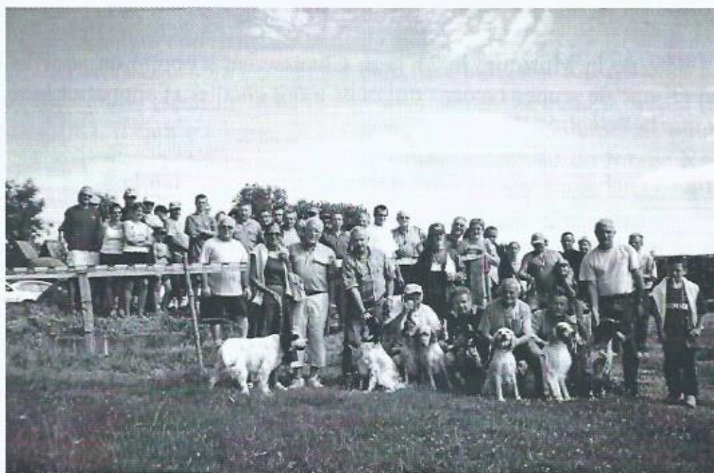
Photo souvenir de la manifestation 2005

Les chaussenacois sont invités à ce spectacle gratuit pour voir travailler des chiens de grande qualité dont plusieurs champions nationaux et internationaux et peuvent réserver une place au repas servi le dimanche dans la grande salle de la « Coopé » (informations et inscriptions au 04-71-69-03-78).