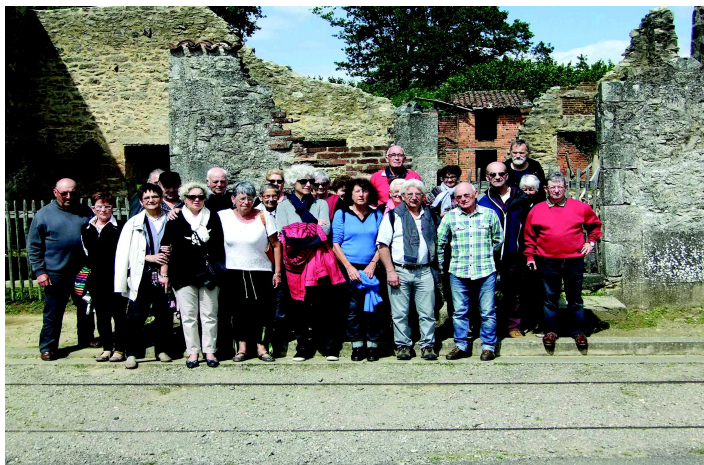
Voyage du 18 juin 2016