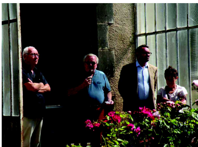
Inauguration de l'expo

Rendez-vous aussi en 2017 à l'exposition de photographies « Quoi de neuf » !