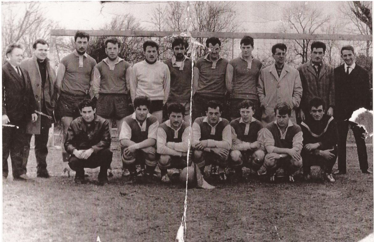
Équipe de l'USC saison 1965-1966 Amusez-vous à retrouver les noms de ces anciens joueurs !

En attendant des jours meilleurs, nous vous souhaitons de passer un agréable été...