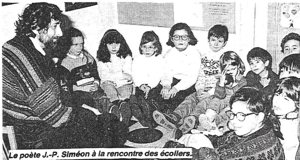
Le poète J.-P. Simeon à la rencontre des écoliers.

L'effectif actuel est donc de 23 élèves (11 CE-CM et 12 CP-Maternelle).